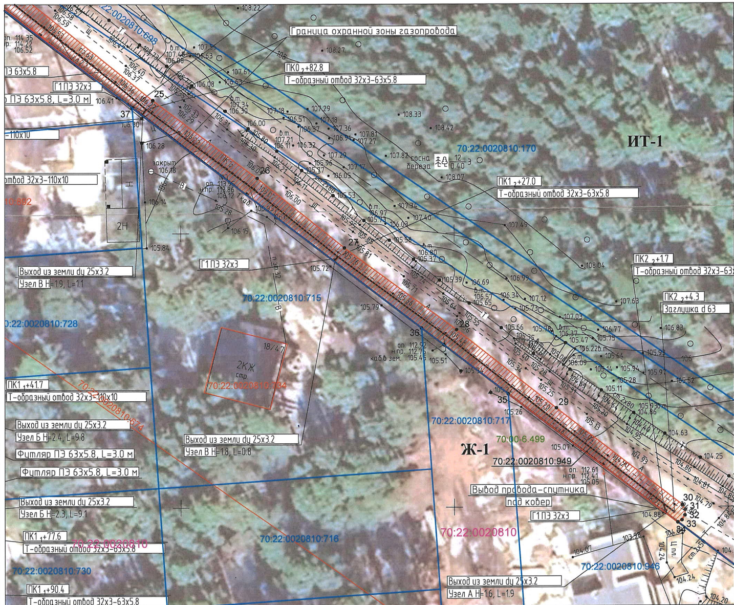
СХЕМА РАСПОЛОЖЕНИЯ ГРАНИЦ ПУБЛИЧНОГО СЕРВИТУТА НА КАДАСТРОВОМ ПЛАНЕ ТЕРРИТОРИИ