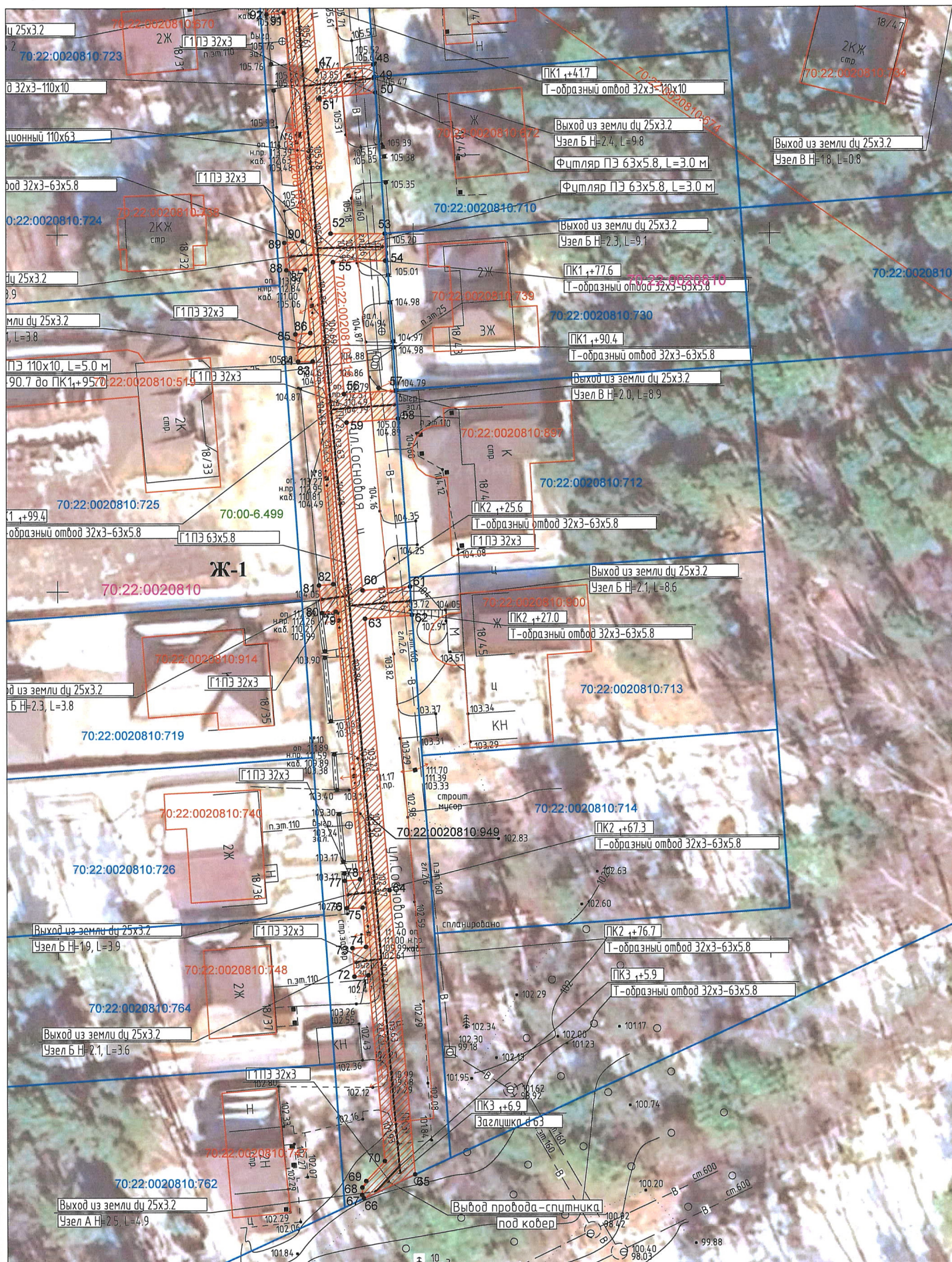
СХЕМА РАСПОЛОЖЕНИЯ ГРАНИЦ ПУБЛИЧНОГО СЕРВИТУТА НА КАДАСТРОВОМ ПЛАНЕ ТЕРРИТОРИИ