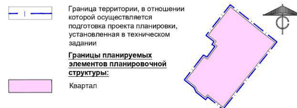
СХЕМА ГРАНИЦ ЭЛЕМЕНТОВ ПЛАНИРОВОЧНОЙ СТРУКТУРЫ